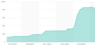
График ссылочной массы

Был проведен анализ конкурентов, который показал, что на сайте очень мало внешних ссылок. Были проведены работы по увеличению ссылочной массы, которая в итоге выросла более чем в 7 раз.